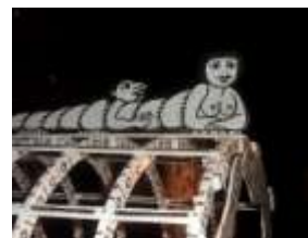
Detail einer Art Brut-Skulptur

Ein Katalog „Raw Vision“ (frz./engl., 368 S., editions Halle Saint Pierre) ist für 40,00 € erhältlich. – www.hallesaintpierre.org